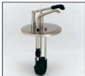
Pompa EDU per cont. da 3 a 10