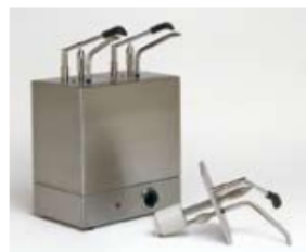
Compl.Pompa + contenitore a 2,3 o 4 vasche