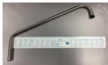
Note diametro standard maggiore lunghezza 270mm