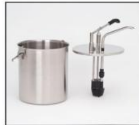
Compl.Pompa + contenitore