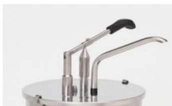
codice beccuccio extra-lungo per salse Misura mm 12mm