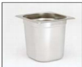
Contenitore in acciaio 1/6 Gastronorm 2,8lt