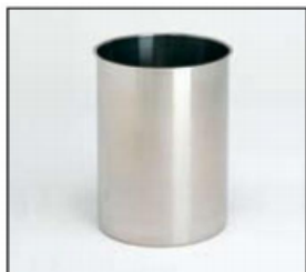
Contenitore in acciaio 3, 4, 6,8,10 lt

Serie EDUZ I dosatori di questa serie sono disponibili solo in configurazione standard con beccuccio sale maggiorato da 16mm (interno 14mm). Indicato per salse con pezzi, crema maggiore pastosità. Fornito con erogatore a pompa di pressione a leva e beccuccio per salse di diametro 16 mm (misura interna 14mm) e pomolo nero.