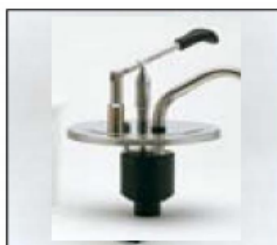
Pompa EDUZ per cont. da 3 a 10