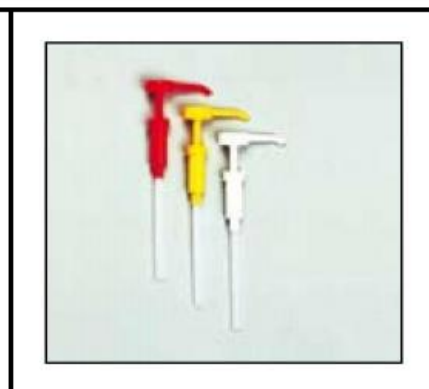
GKC - R - M - 35 singolo da 350ml