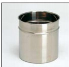
Contenitore in acciaio 4, 6 lt

Dosatori termici in acciaio inox 18/8 per coperture e salse calde, con pompa a leva, e contenitori interni cilindrici in acciaio 18/8. Erogazione regolabile fino a 40gr. Resistenti a temperature fino 120°.