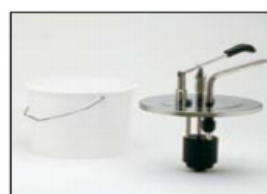
Secchio H. in plastica 3, 5, 10 lt