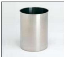
Contenitore in acciaio 3, 4, 6,8,10 lt

INDICARE IN FASE ORDINE TIPO DI EROGATORE, beccuccio o ago, verso alto o 45° verso basso, diametro ago. Possibilità di