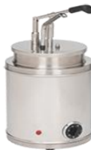
Compl.Pompa + contenitore 4 o 6lt