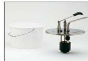
Secchio H. in plastica 3, 5, 10 lt